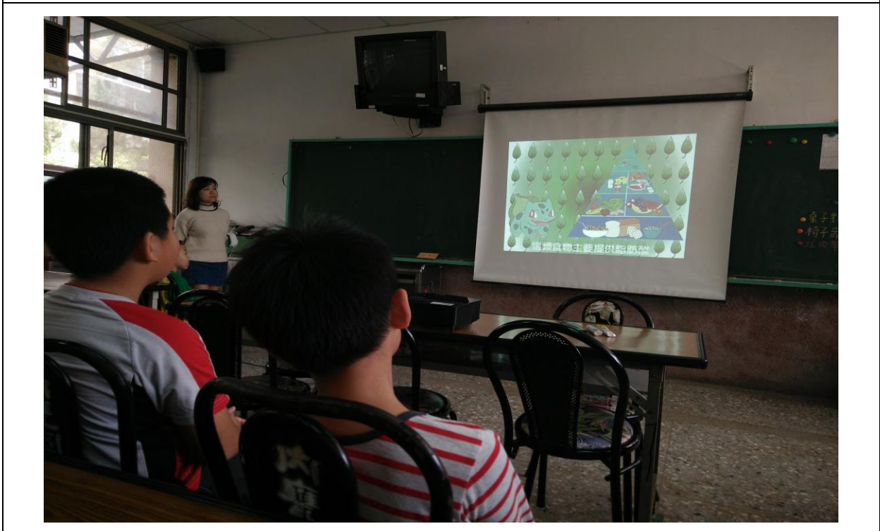
利用卡通影片賞析加深孩子對六大類食物的觀念