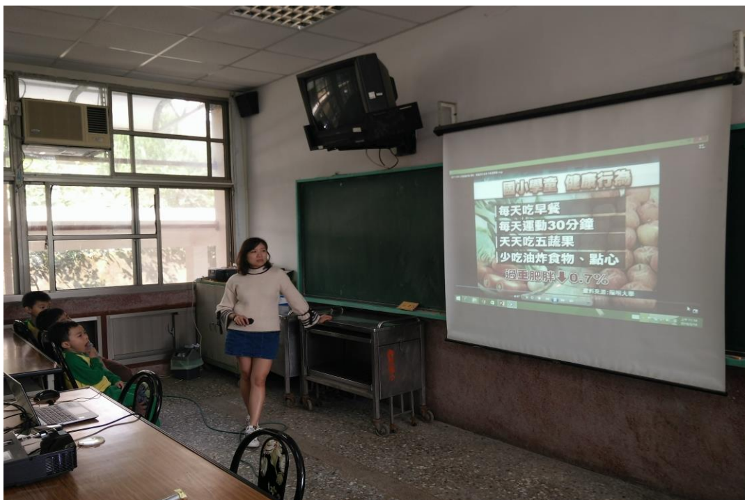
教導孩子做好健康行為才能有效控制體重