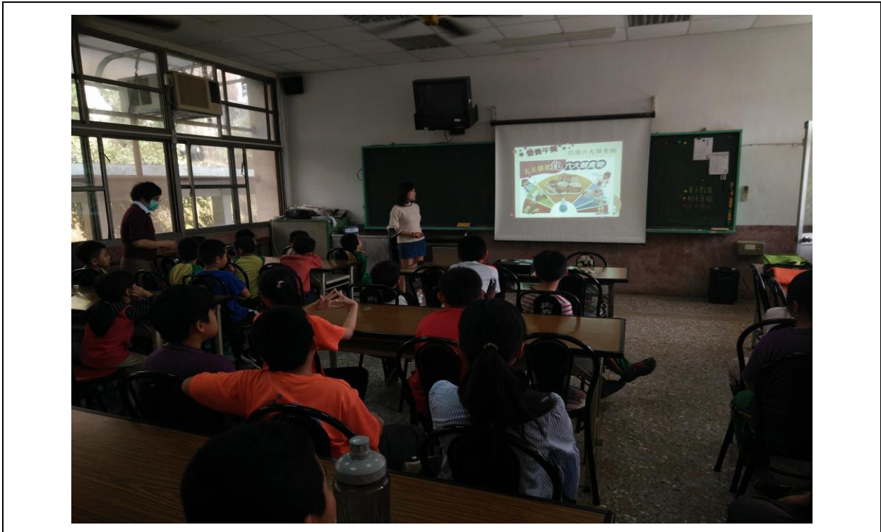
由護理師向孩子說明介紹六大類食物