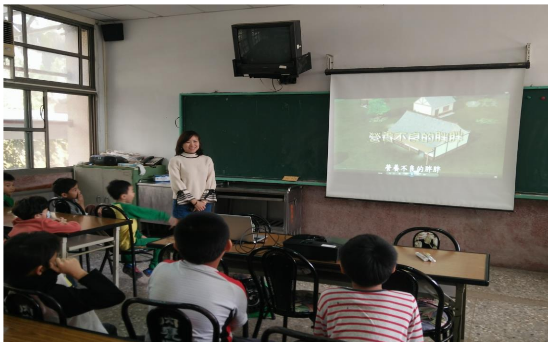
利用卡通影片加深孩子對均衡飲食與體位適中的重要性