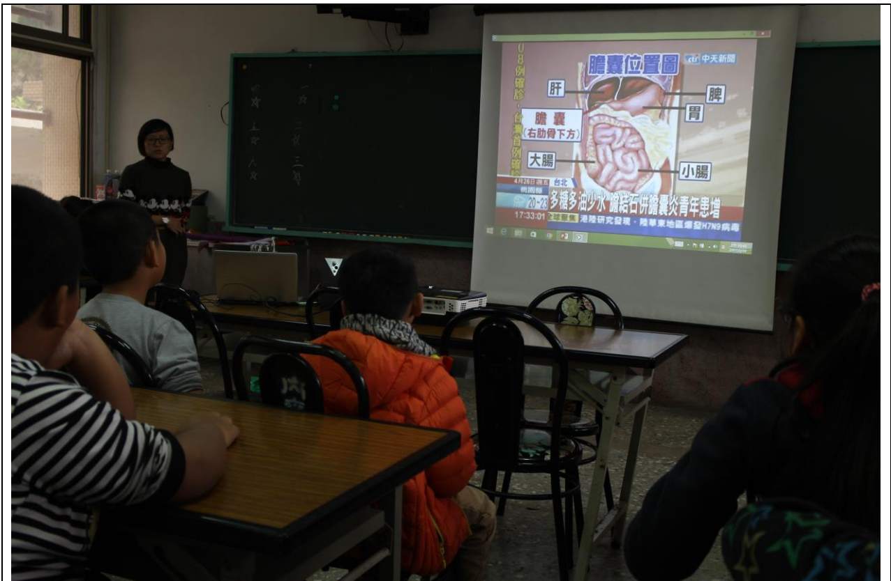
利用影片賞析向學生宣導多糖多油少水會引發膽囊結石