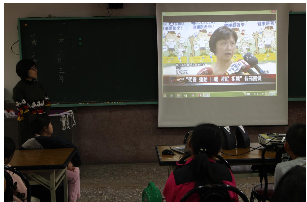
向學生宣導：長高關鍵是” 營養、運動、日曬、睡眠、拒糖”