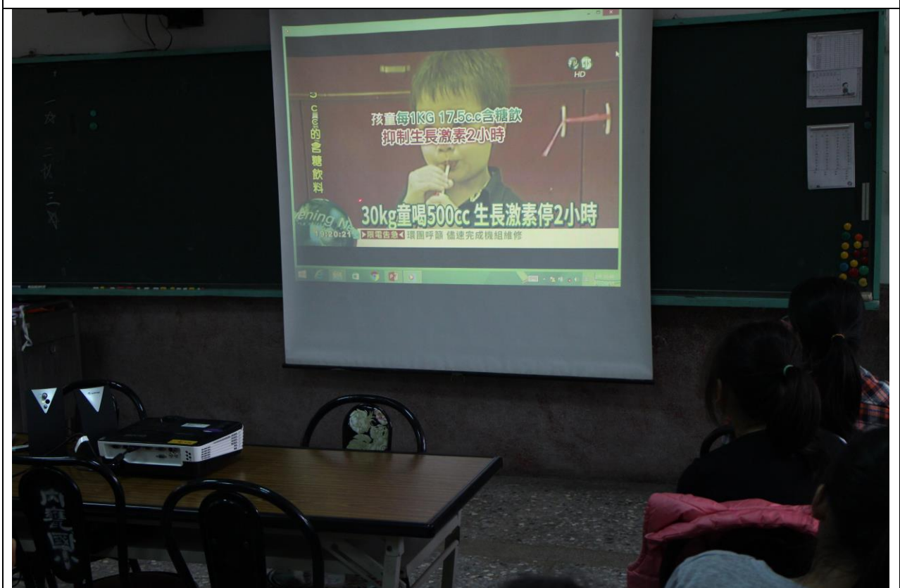
利用影片賞析向學生宣導含糖飲料會抑制生長激素分泌