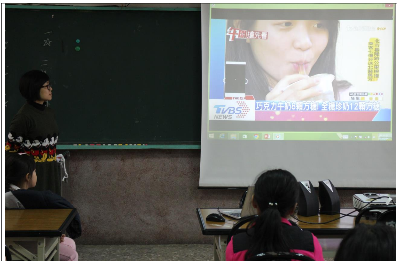
利用影片賞析向學生宣導含糖飲料的多糖陷阱