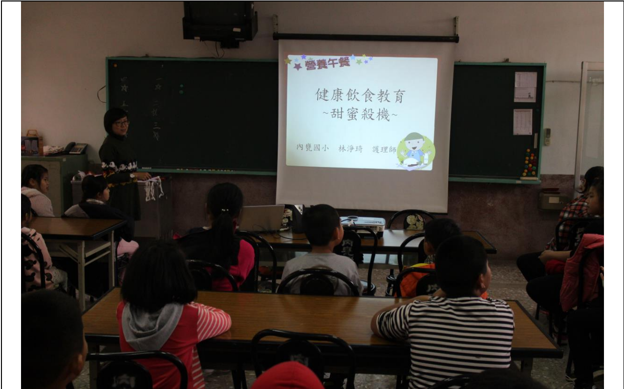
本校護理師向學生進行健康飲食教育宣導