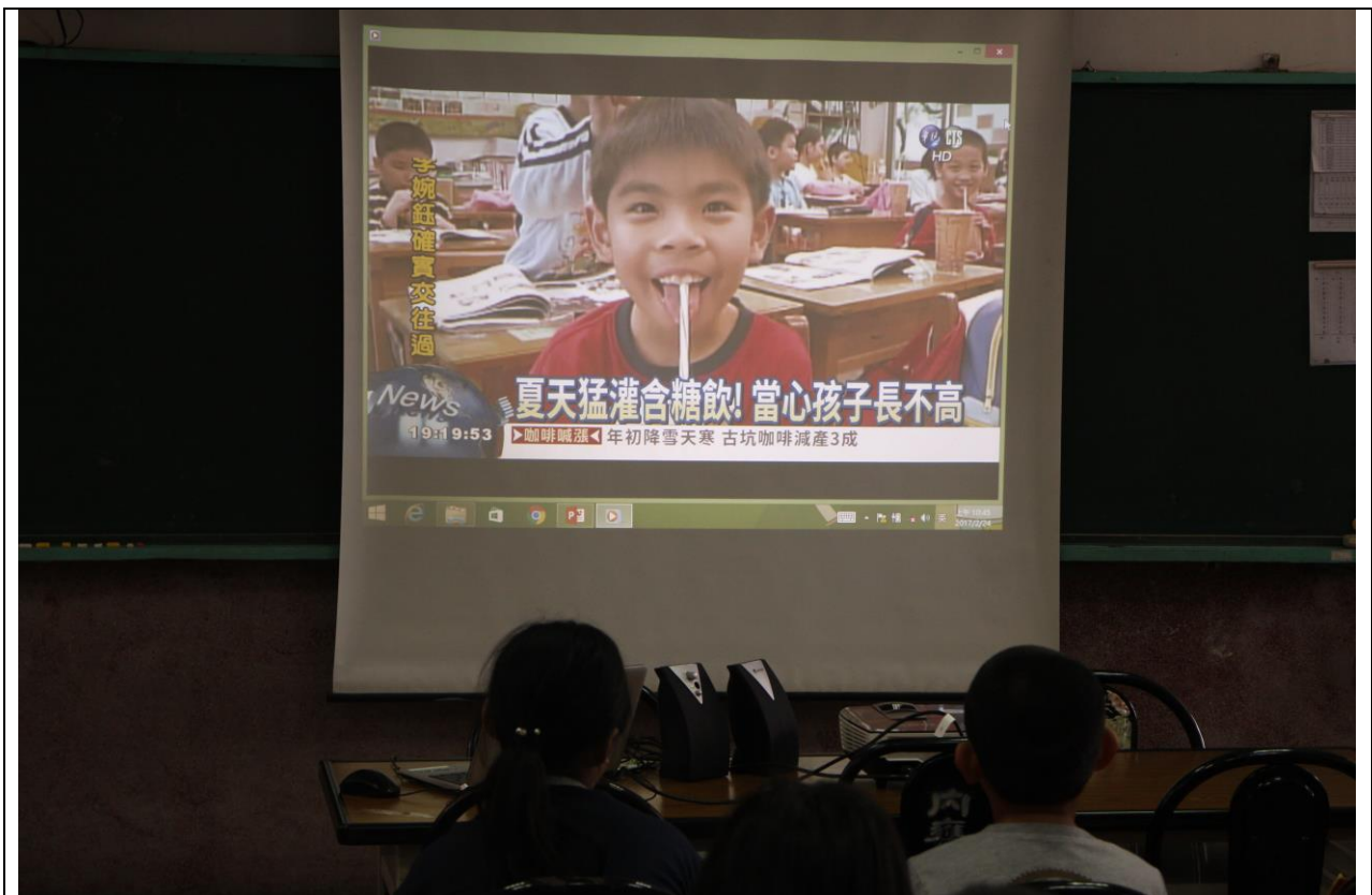
利用影片賞析向學生宣導狂喝含糖飲料會長不高