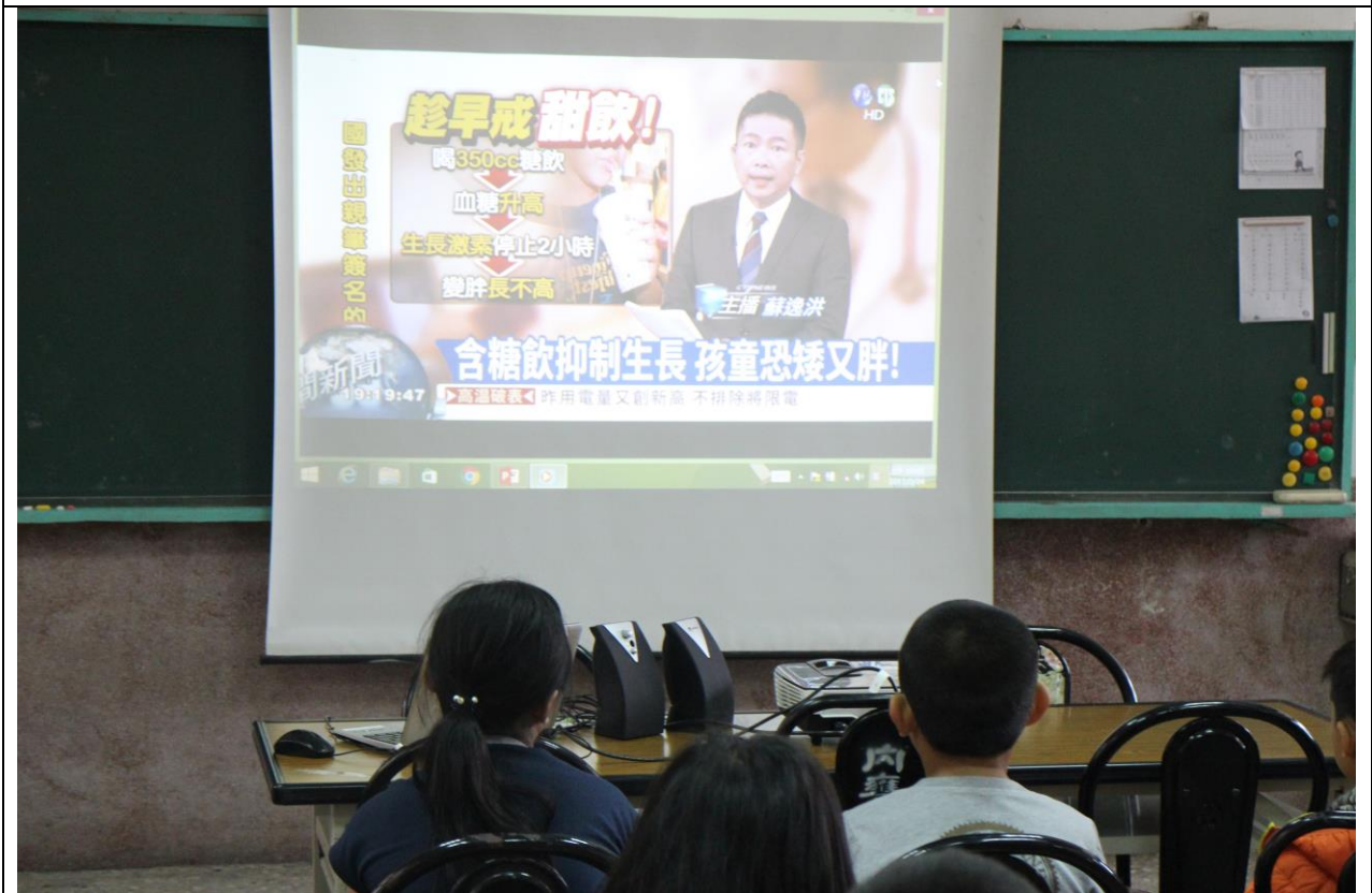
利用影片賞析向學生宣導含糖飲料對健康體位的危害