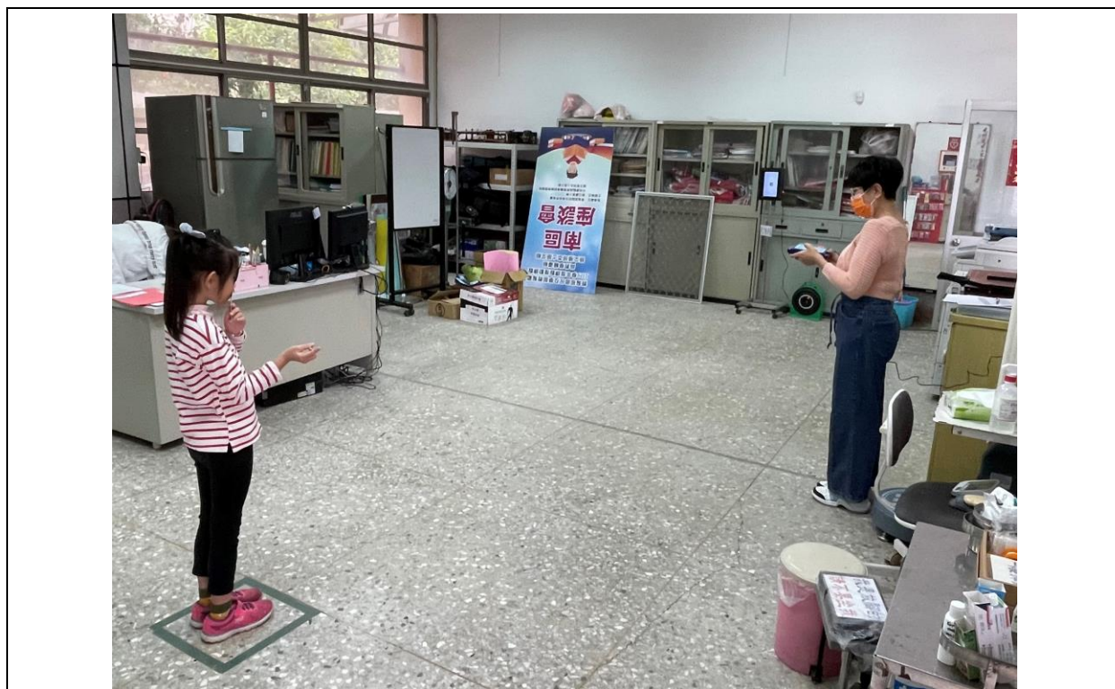
2. 視力檢查方式(距離、燈光、人流控制)符合標準流程