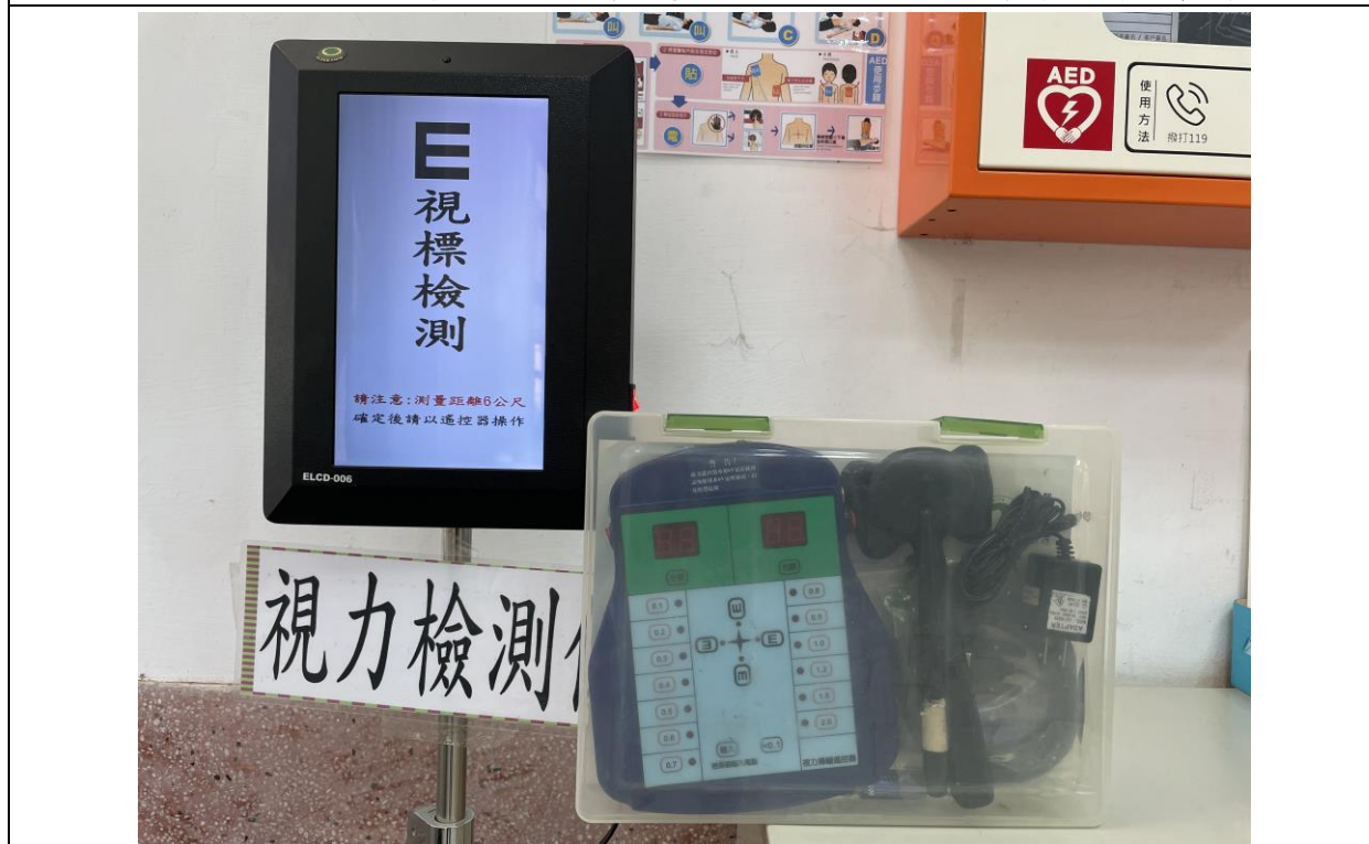
1. 各項視力檢查器材、檢查環境設置及檢查方式符合教育部規定