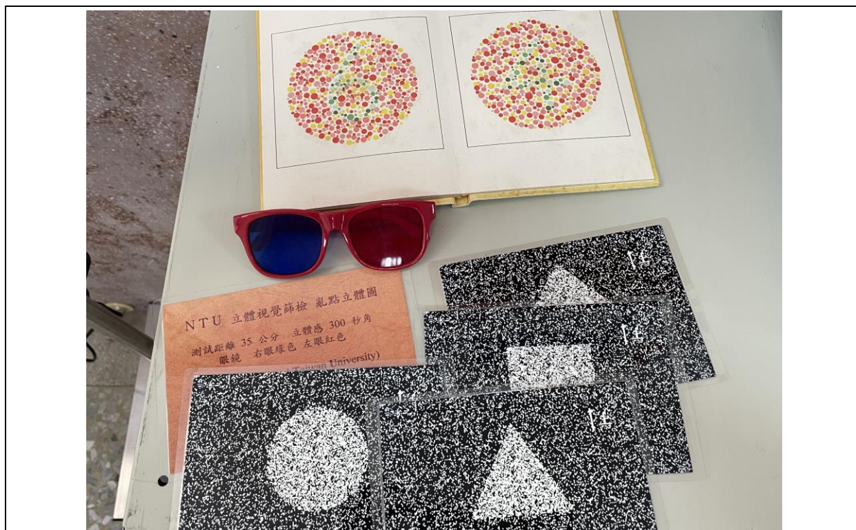
1. 各項視力檢查器材、檢查環境設置及檢查方式符合教育部規定