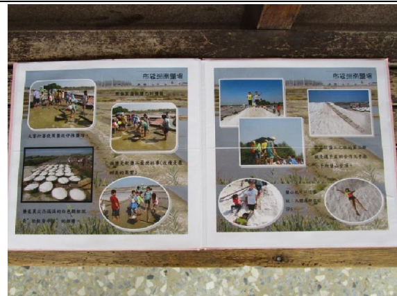
這本手工得到第三名喔!