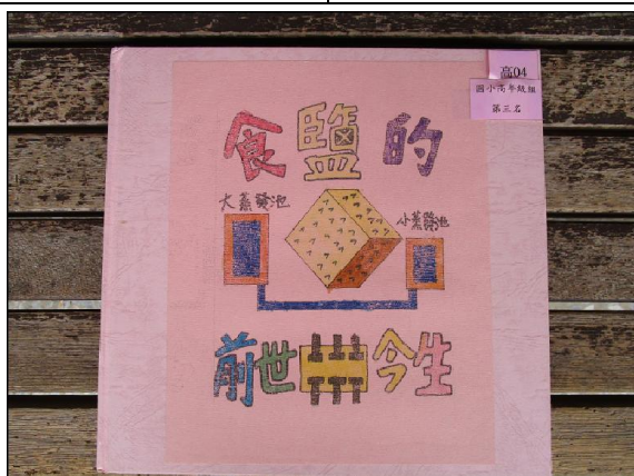
小朋友動手做的手工書