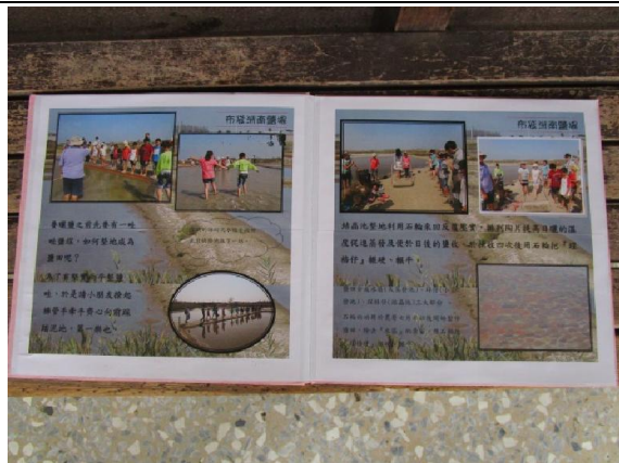
手工書豐富的内容