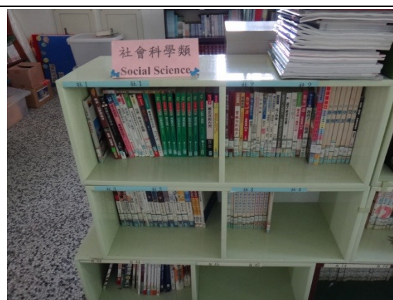
分門別類的圖書擺設