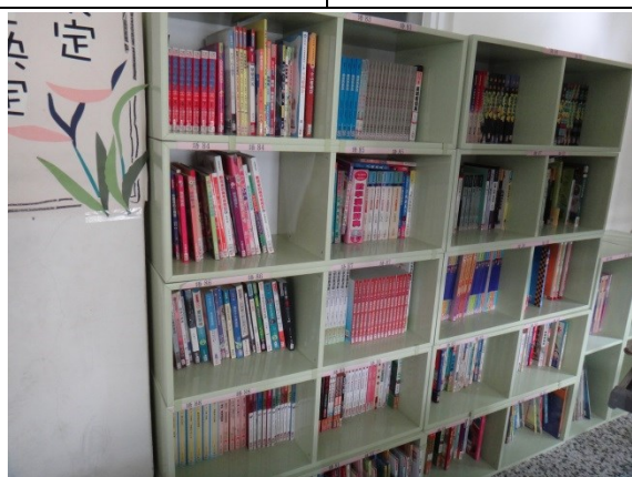
排放整齊有序的圖書