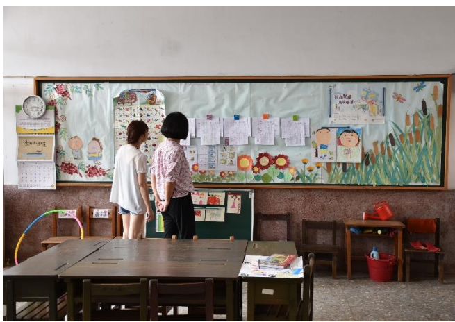
老師觀摩教室布置