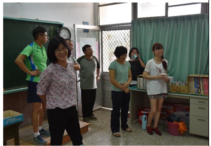
老師觀摩學生作品