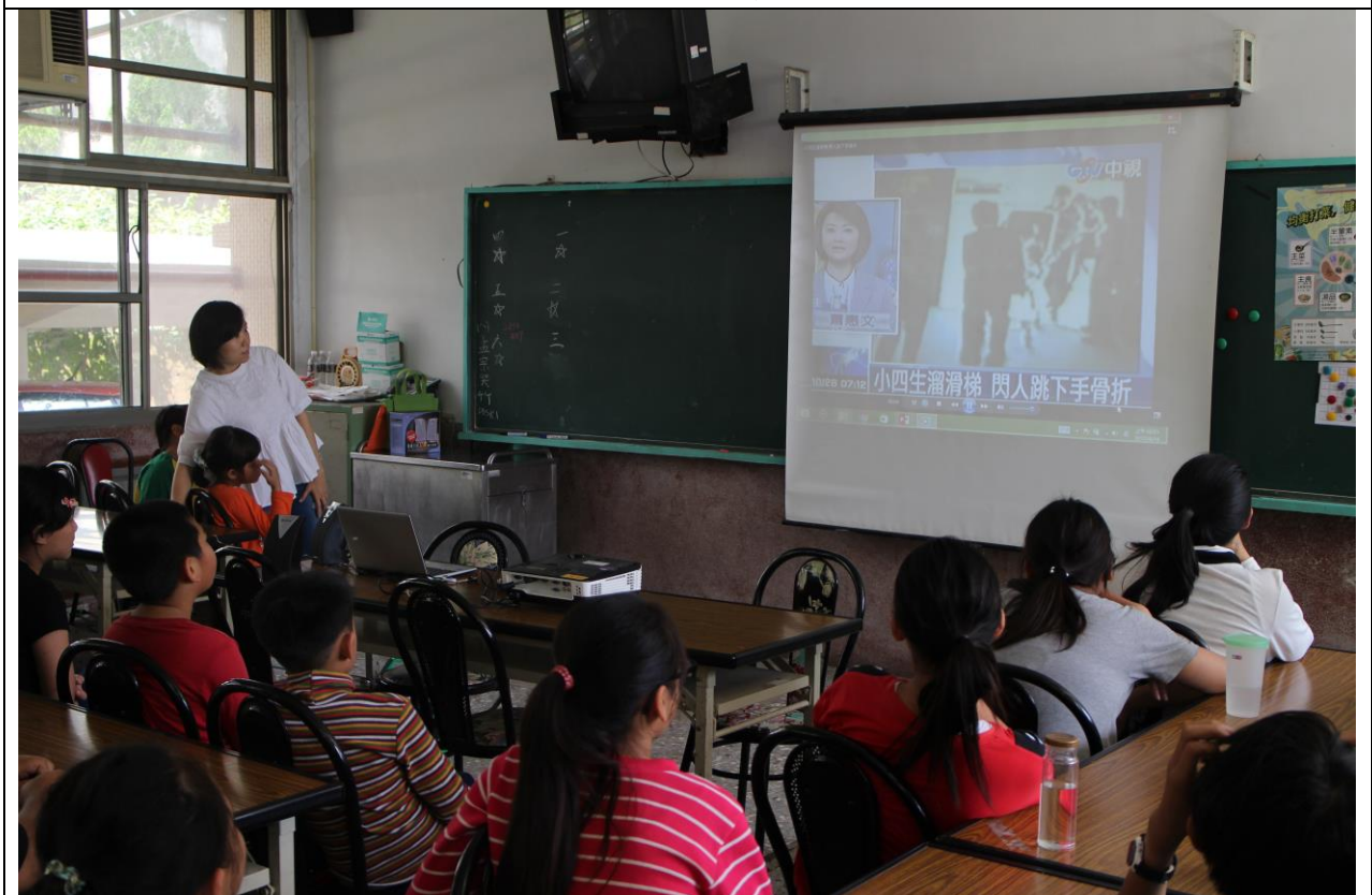
利用影片介紹遊戲器材使用不當的結果