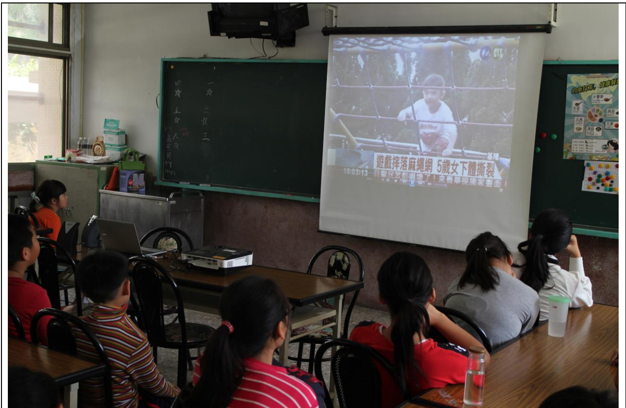
利用影片介紹遊戲器材使用不當的結果