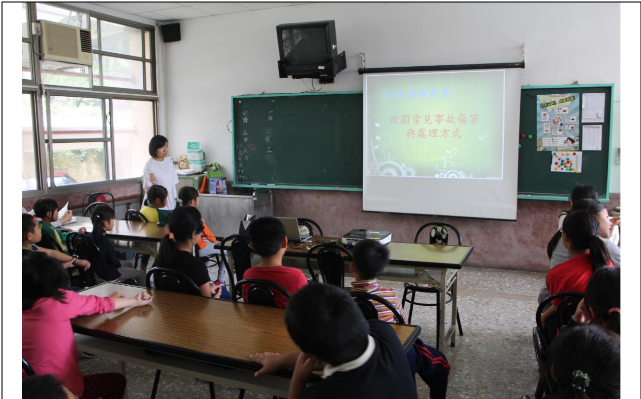
本校護理師向學生進行校園常見事故傷害預防宣導