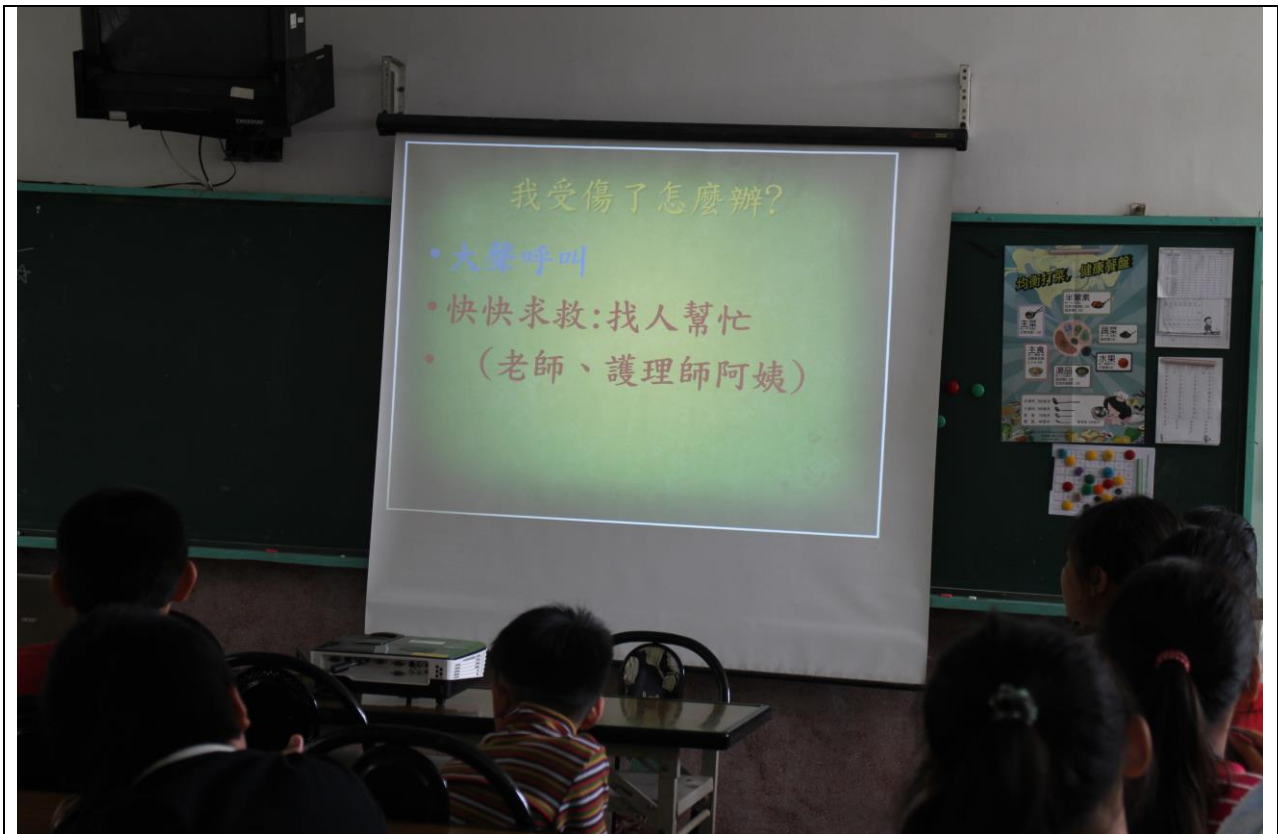
教導學生受傷之後要立刻呼救、尋求師長協助