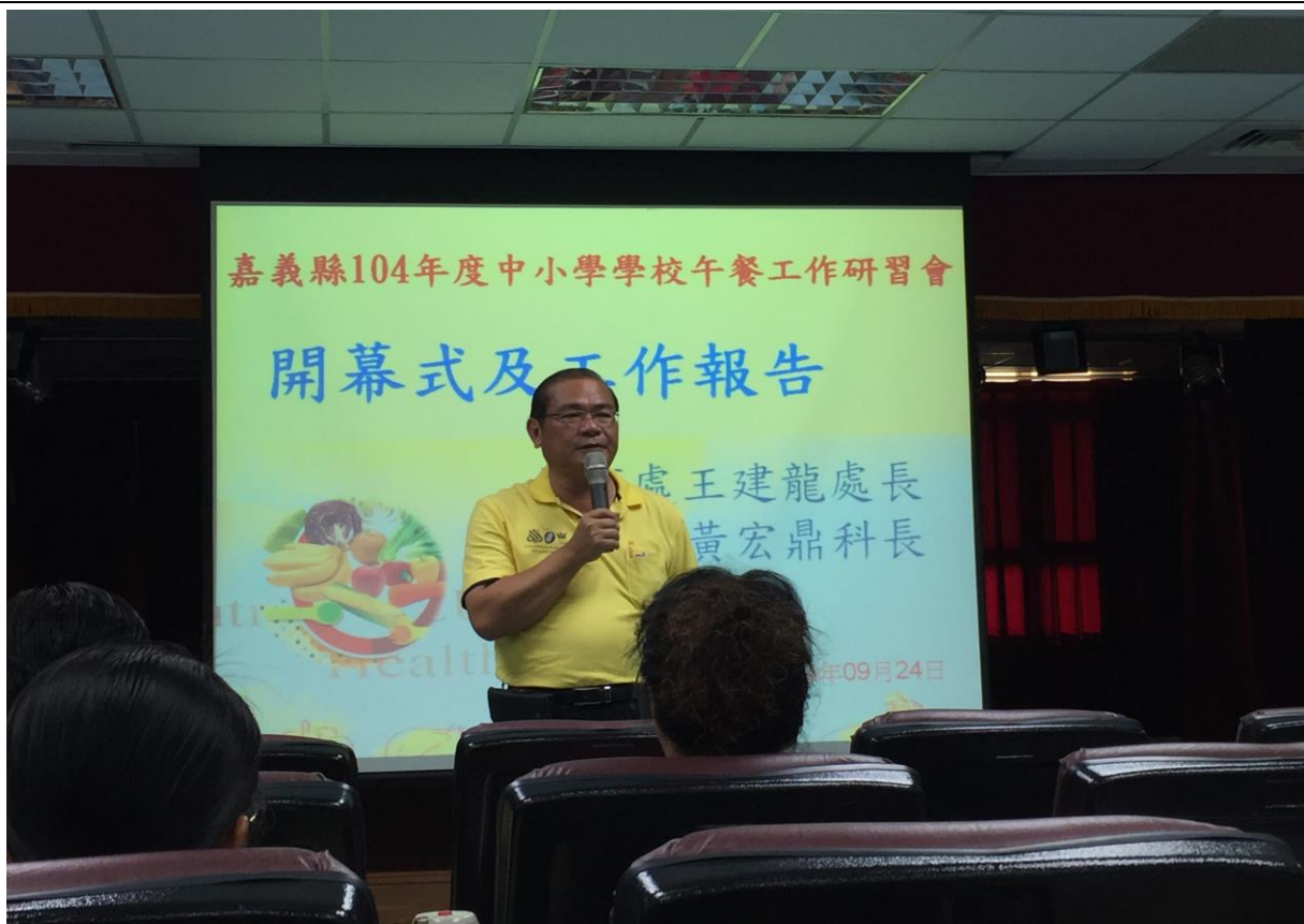
20150924 嘉義縣 104 年度中小學學校午餐工作研習會