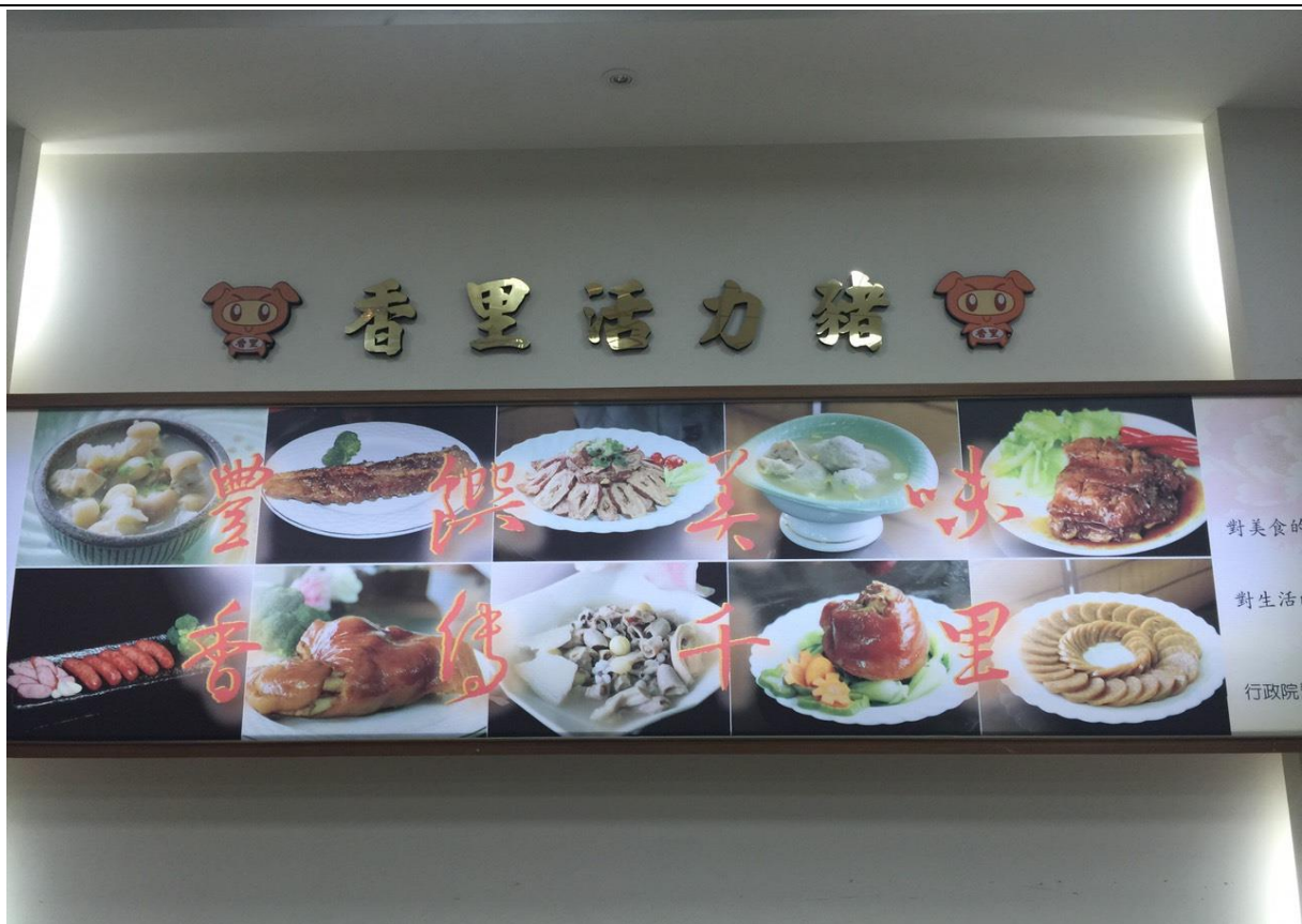
20151209 嘉義縣 104 年度中小學學校午餐工作外埠參觀研習