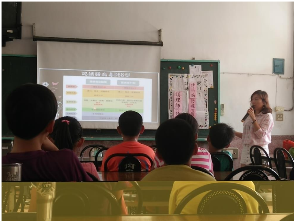
護理師向孩子說明介紹新型腸病毒 D68 型