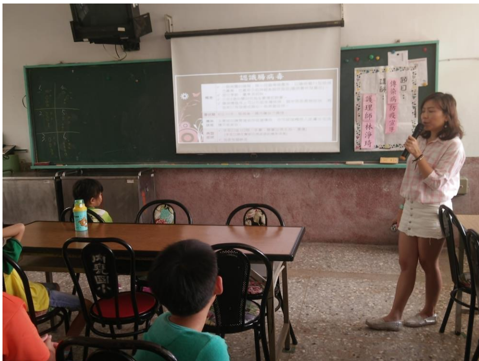
護理師向孩子說明介紹腸病毒的症狀