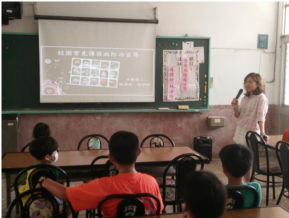
由護理師向孩子說明介紹校園常見傳染病的種類