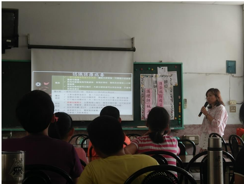
護理師向孩子說明介紹諾羅病毒的症狀