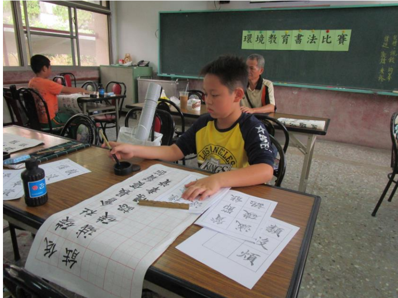
環境教育書法比賽

從低年級的硬筆字教學到中高年級書法課，是本校重點推動的特色課程，與環境教育結合辦理比賽，從「寫」中「知」，進而力行之。