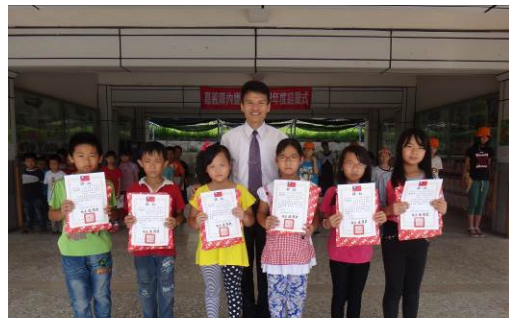
好書介紹海報製作成績優異