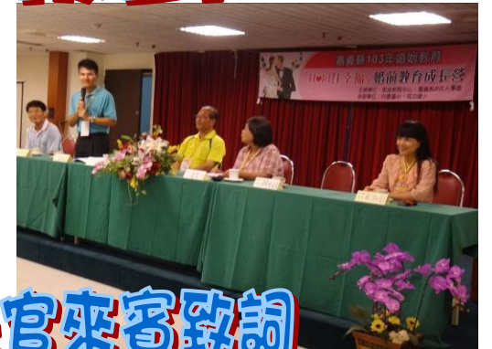
始業式 長官來賓致詞