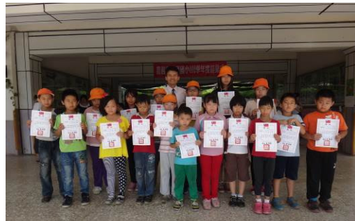
第三次月考成績優異 進步獎