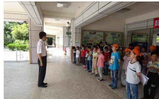
校長宣導暑期注意事項