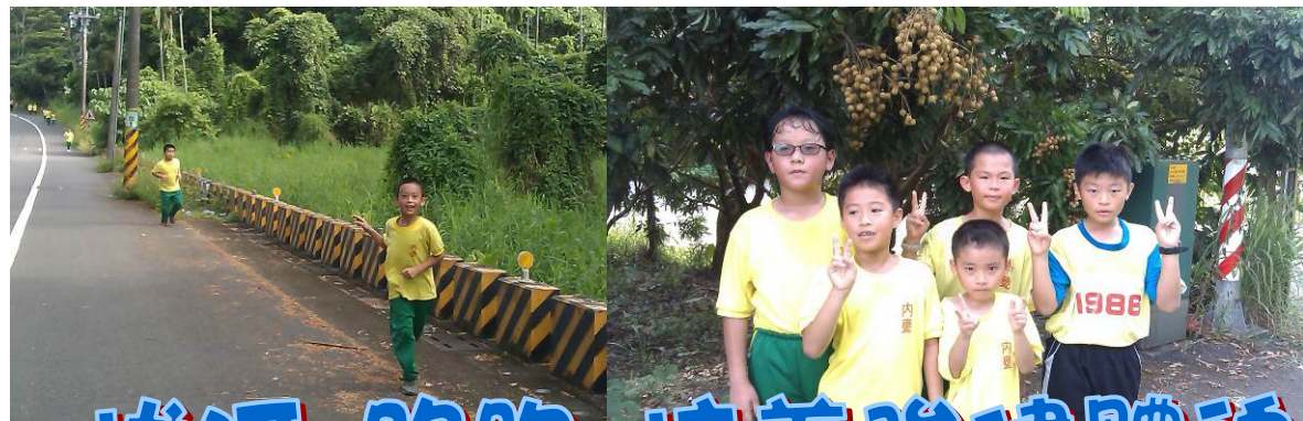
拔河 路跑 培養強健體魄