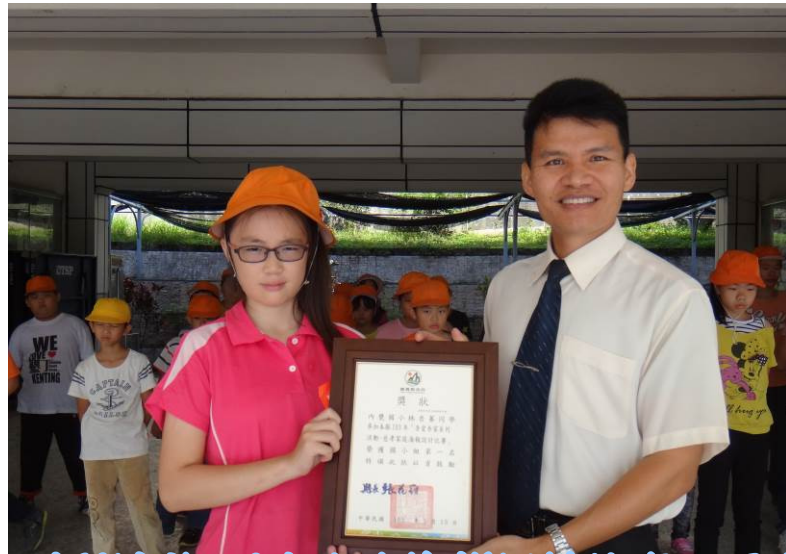
「吾愛吾家系列活動-德孝家庭海報設計比賽」國小組第一名