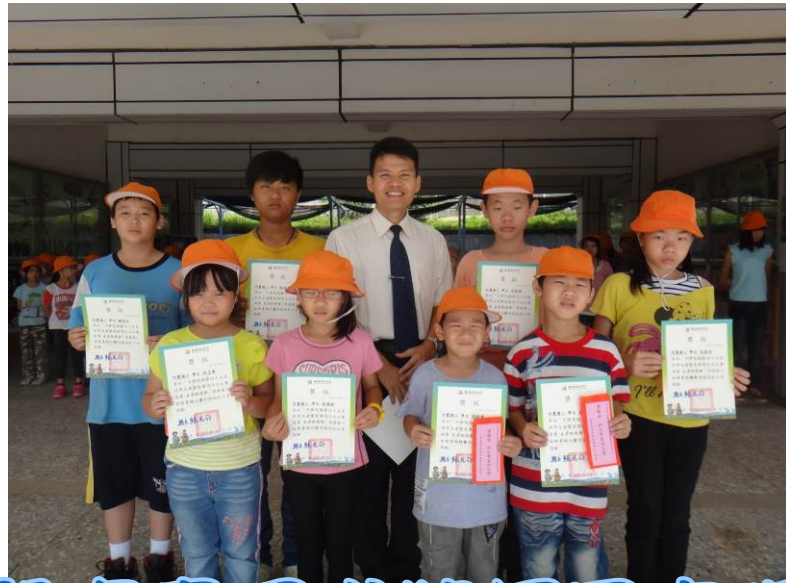
世界兒童畫展成績優異表現亮眼