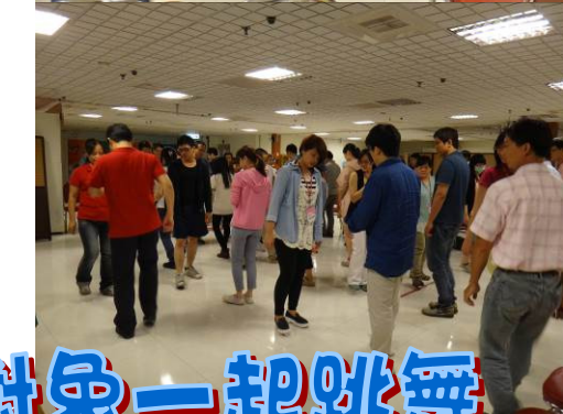
邀請心儀對象一起跳舞