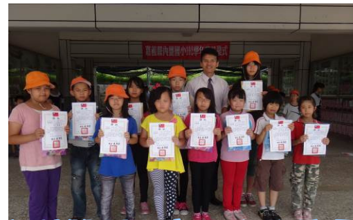
學習單暨小書製作成績優異