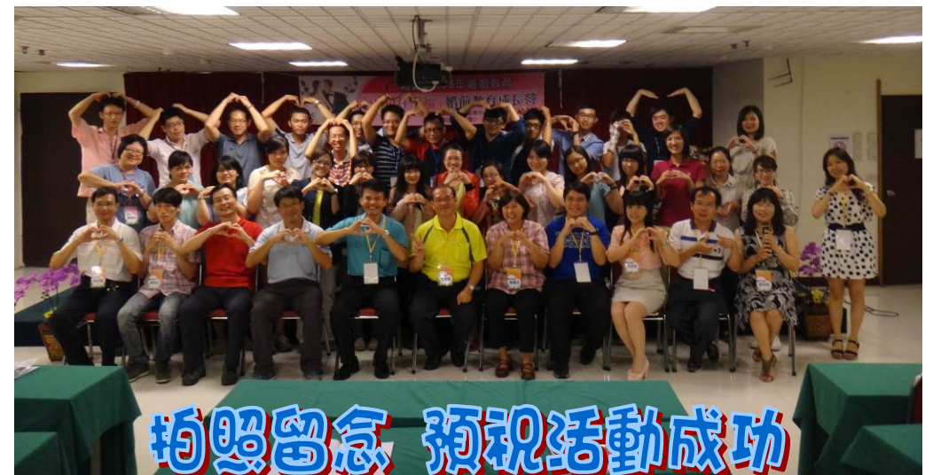
拍照留念 預祝活動成功