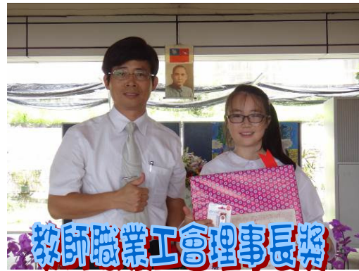
教師職業工會理事長獎