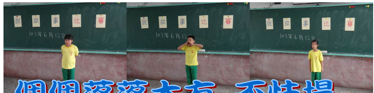
個個落落大方 不怯場