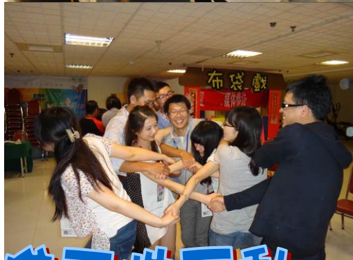
團體遊戲 增進兩性互動