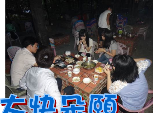
烤肉派對大快朵頤