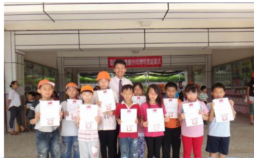
第二次成語考查成績優異