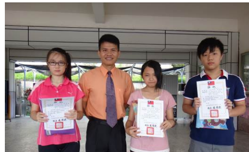
閱讀小書製作優異