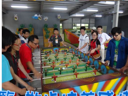
童年度假村園區導覽 散步培養感情