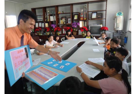
靠英語能力闖過重重考驗