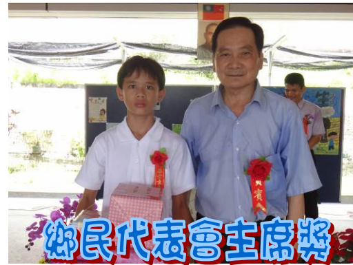
鄉民代表會主席獎