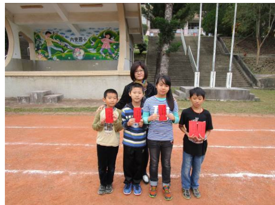
縣級以上比賽前三名 接受鄉長獎勵金