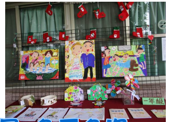
各班藝文成果展 多采多姿