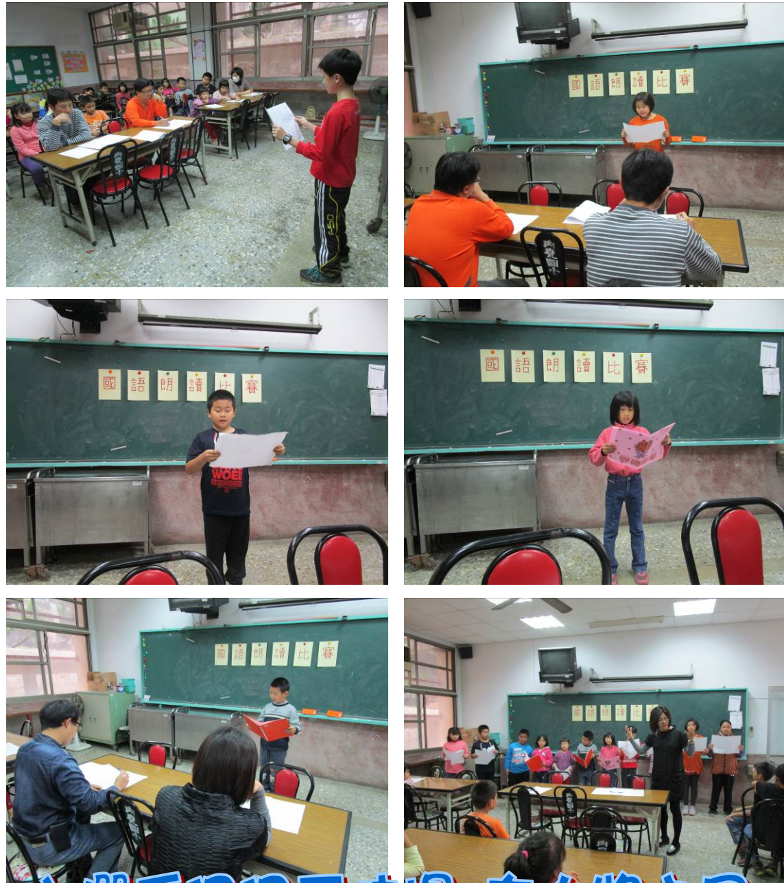
小選手個個不怯場 有大將之風