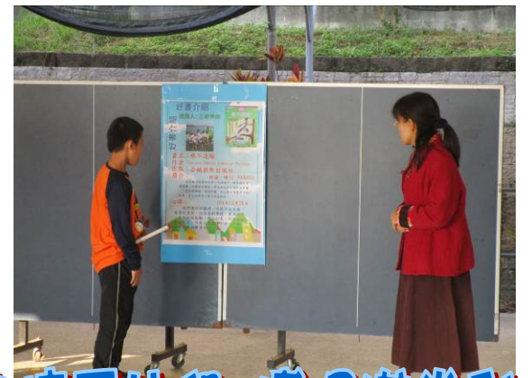
以短劇呈現書中精采片段 博得滿堂彩