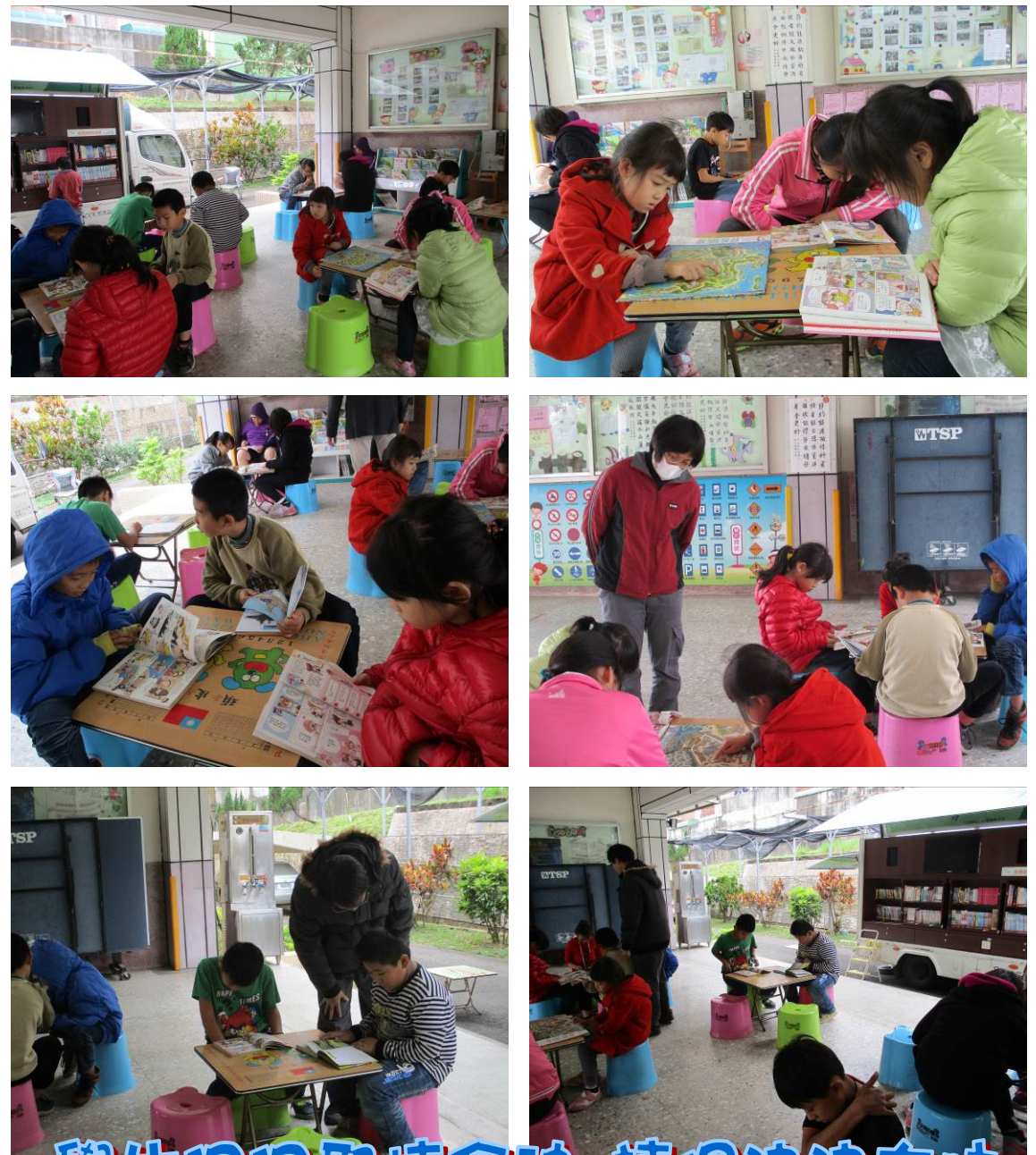
學生個個聚精會神 讀得津津有味