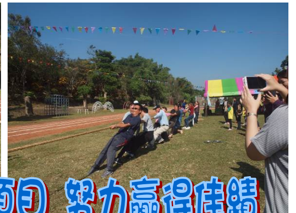
豐富有趣的競賽項目 努力贏得佳績