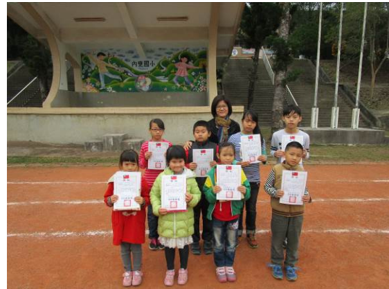
借閱排行榜 閱讀小碩士班獎