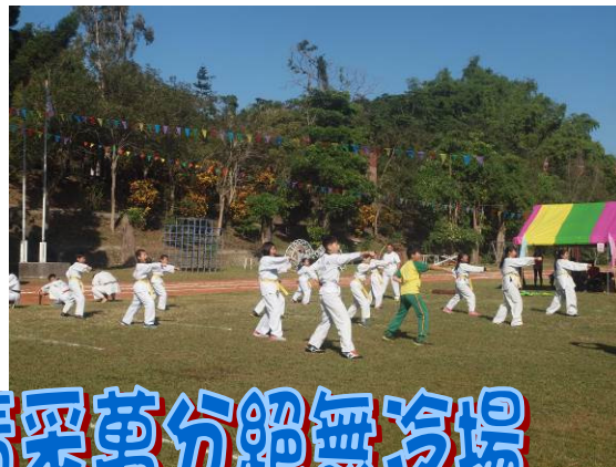
班級社團表演 精采萬分絕無冷場