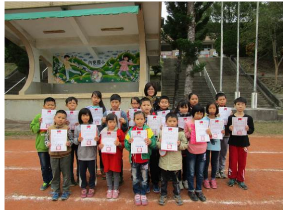
第二次月考優秀同學