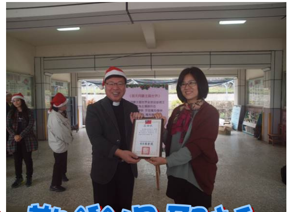
全校齊同樂 歡樂過聖誕