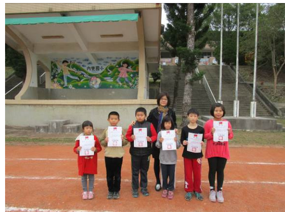
國語朗讀優秀同學