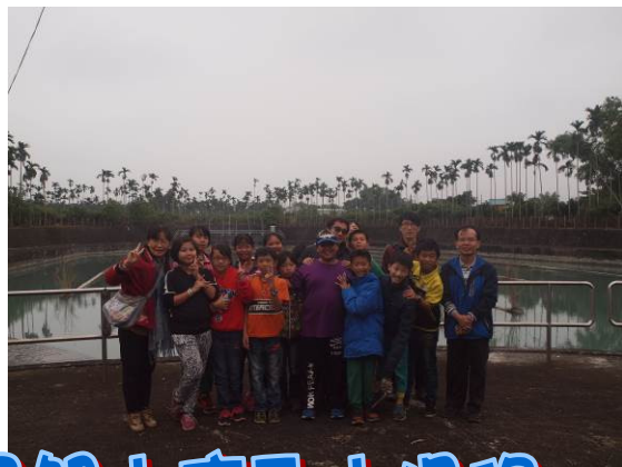
參觀自來水廠 了解水庫取水過程