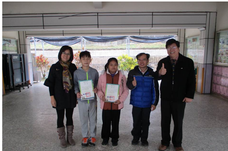
督學蒞校頒發投稿刊登獎