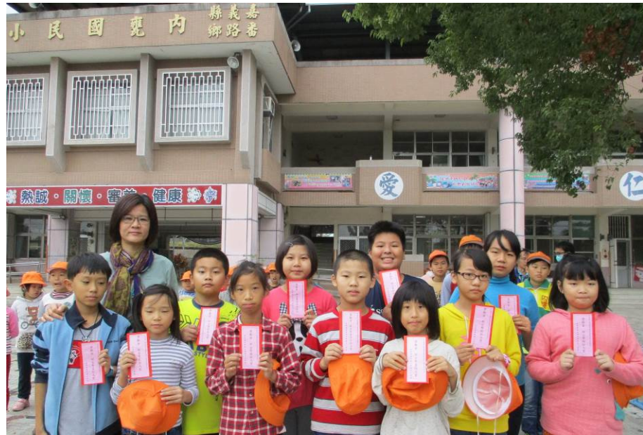
環境教育書法比賽獲獎同學