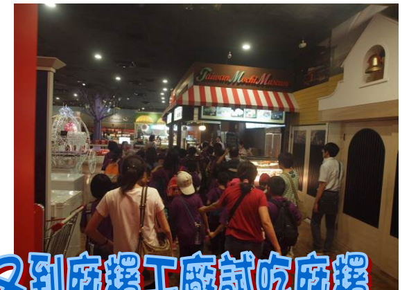
參觀手工藝文物館 又到麻糬工廠試吃麻糬