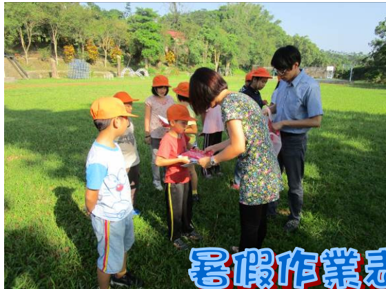
暑假作業表現優秀同學