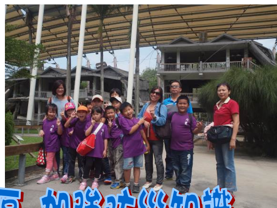
參觀地震教育園區 加強防災知識