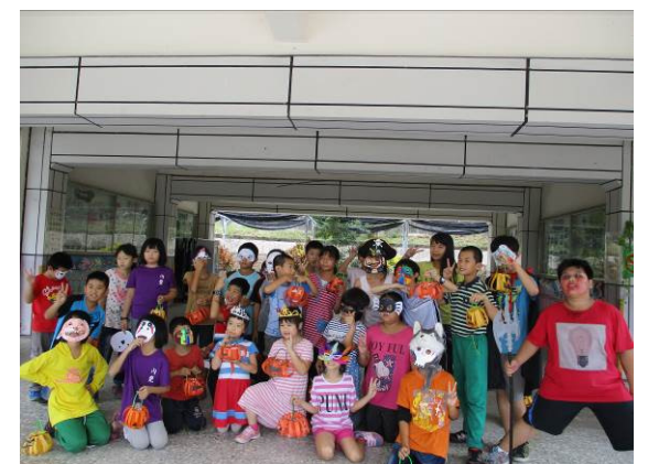
不給糖就搗蛋 孩子歡樂搞鬼