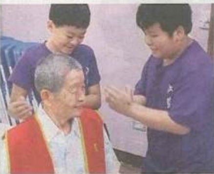
▶內甕國小學生為長者 搓背按摩。

陪伴談天按摩 嘉義內甕關懷長者 李榮茂／嘉義報導 重陽節即將到來，嘉義縣內甕國小日前參加華山基金會番路愛心天使站感恩茶會，學生吹奏直笛，並為獨居老人量血壓、搓背、按摩，還唱生日快樂歌，以實際行動表達對獨居長輩的關懷和祝福。