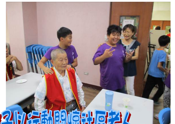
直笛演奏 量血壓 按摩... 孩子以行動關懷社區老人