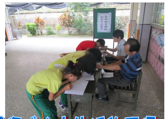
經由體驗活動 了解身障人士生活的不便