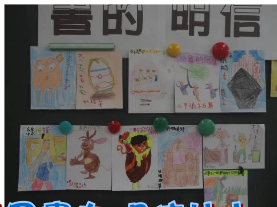
將喜愛的繪本插圖畫在明信片上