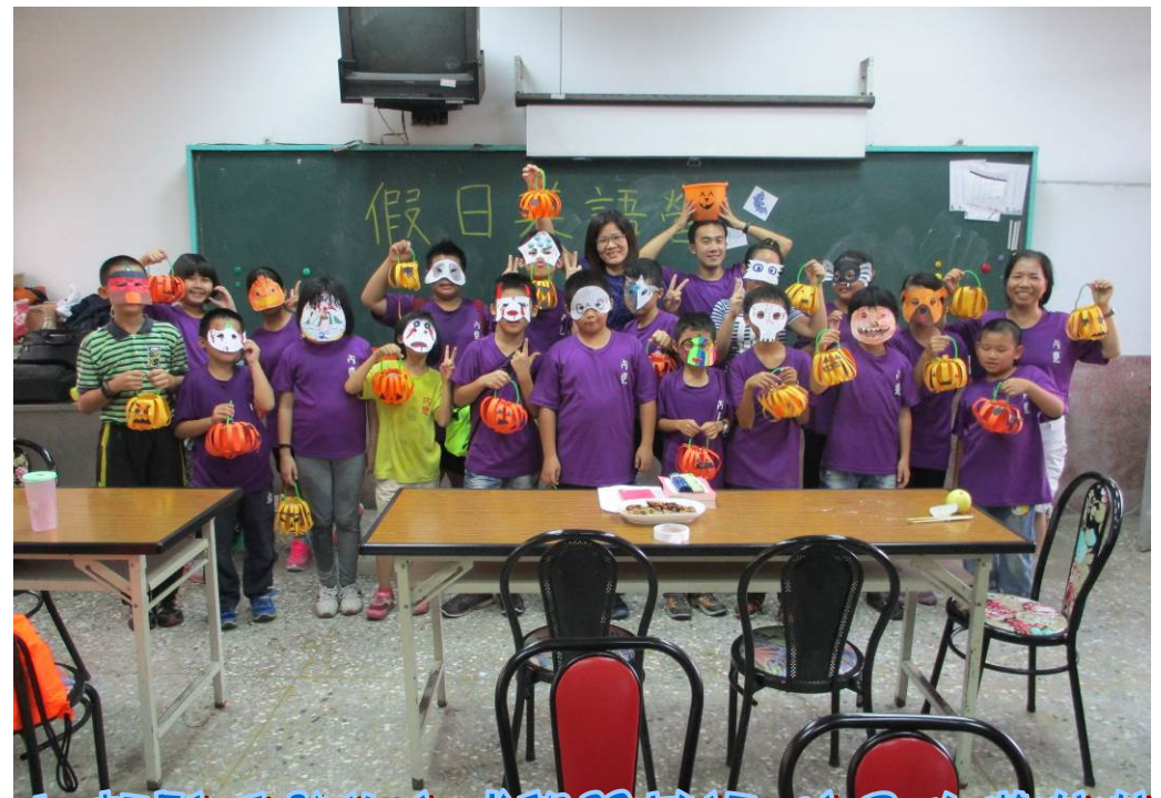
以輕鬆活潑的方式學習英語 孩子收穫滿滿