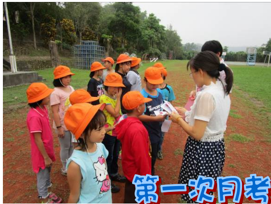
第一次月考成績優秀同學