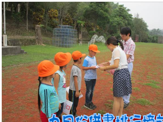
九月份借書排行榜前三名 閱讀小學士頒獎