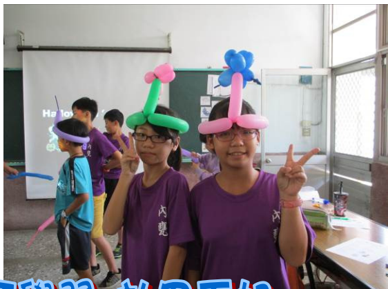
由生活中落實英語學習 效果更好