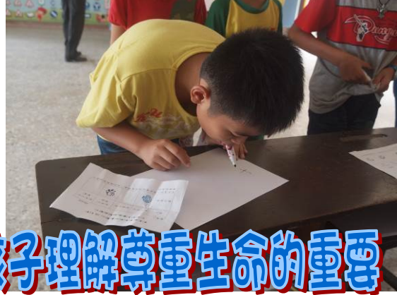
豐富的體驗活動 讓孩子理解尊重生命的重要