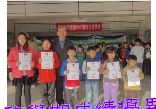
第三次成績考查成績優異及進步獎 整學期成績優異