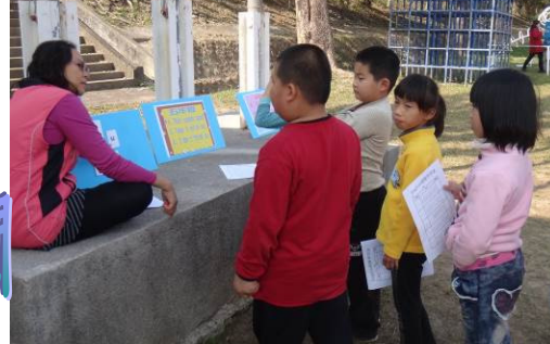
回答正確方可過關