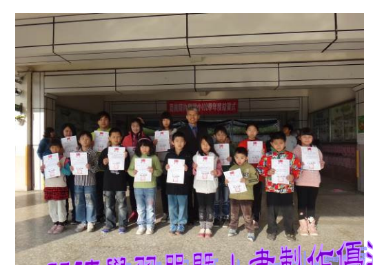
好書介紹暨海報設計優選 閱讀學習單暨小書製作優選