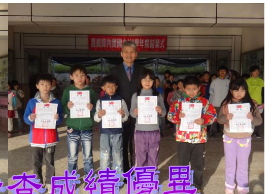
第二次成語考查成績優異