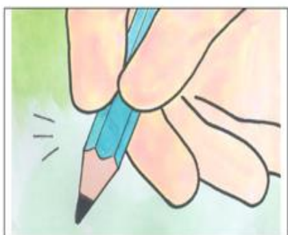
☉離筆尖•三公分•筆身輕輕靠