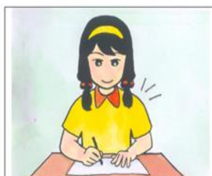
☉兩肩平•放輕鬆•歡喜來寫字