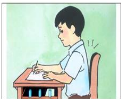
☉學寫字•坐端正•腰打直