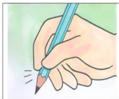
☉大拇哥•二拇弟•中指來挺筆