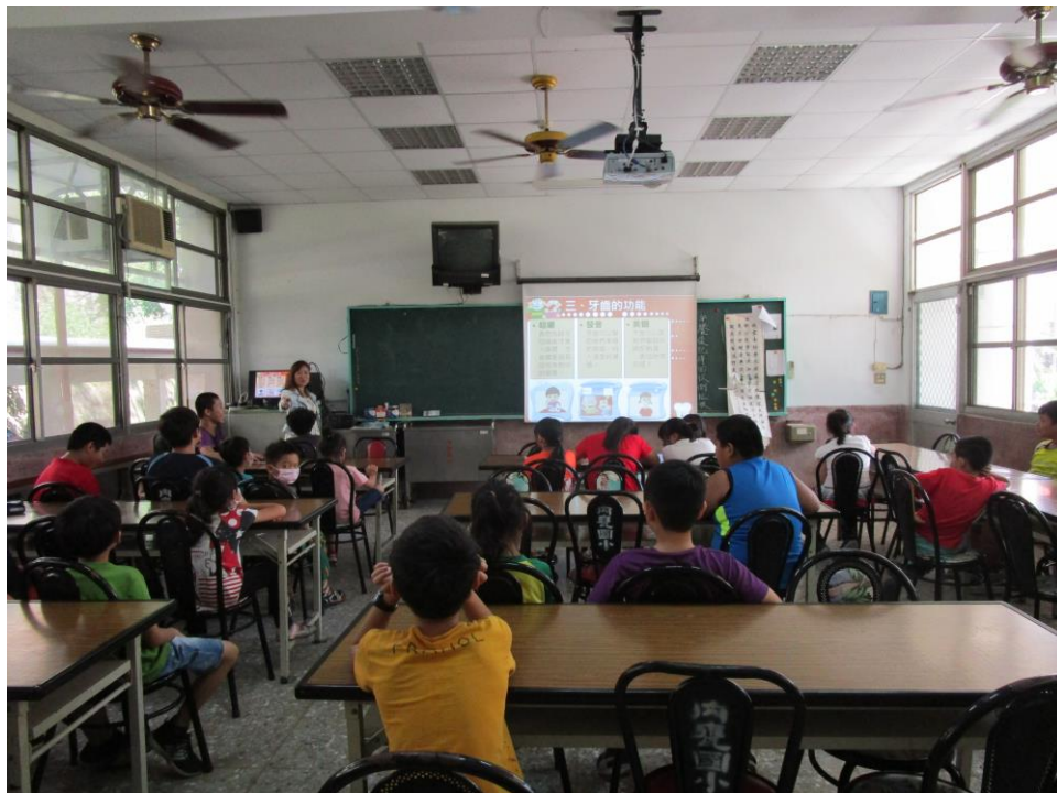
教導孩子認識牙齒的功能