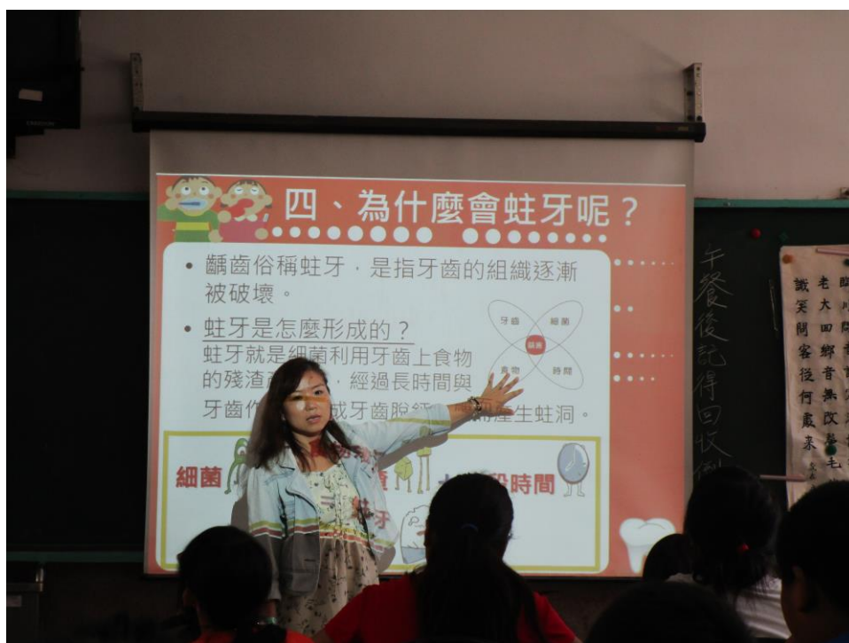
教導孩子蛀牙的原因