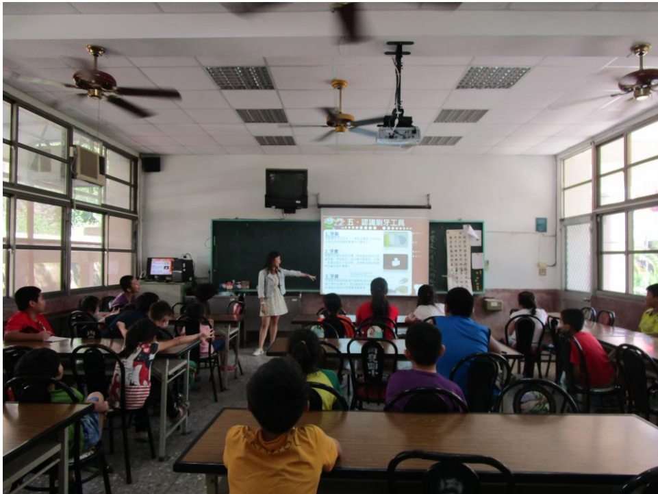
一起來認識刷牙的工具