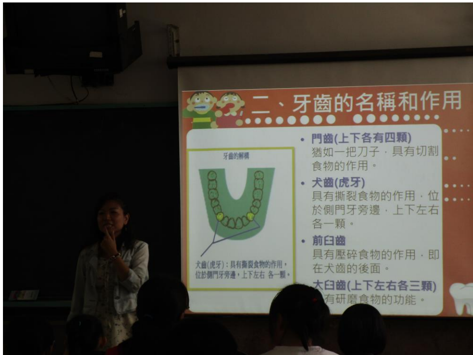
教導孩子認識牙齒的名稱與構造